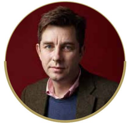
胡润 Rupert Hoogewerf