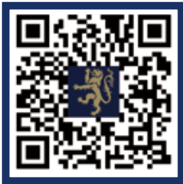
AISL 哈罗学校官方网站