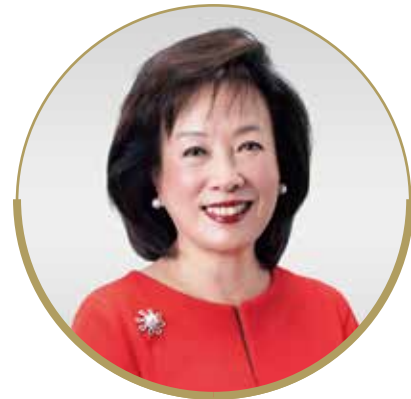
王莒鸣博士 DBE 太平绅士