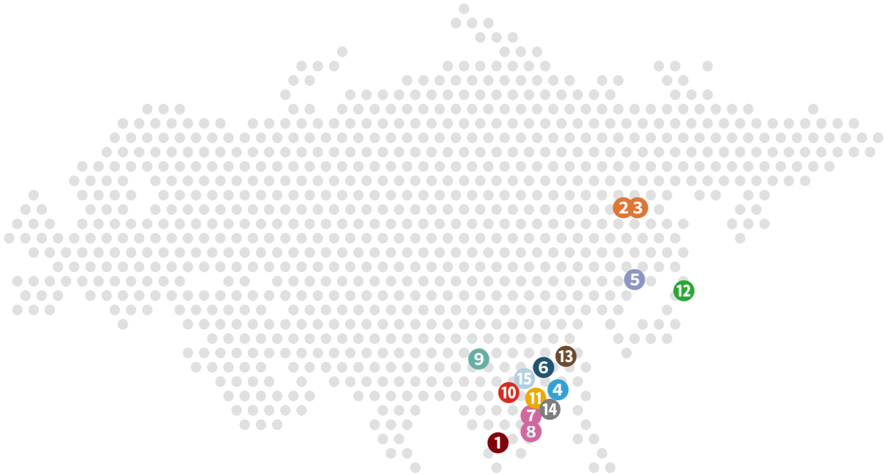
表 2：AISL 哈罗学校地区分布及成立时间