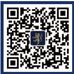
AISL 哈罗学校微信公众号