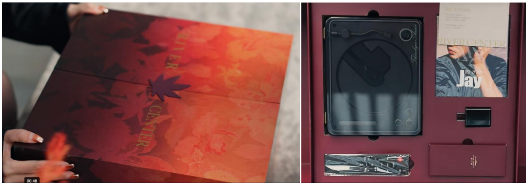
图：长沙滨江境定制时光礼盒

成都嘉佰道的 交付通知函和 EMS 邮件外包装均为定制设计 ，通知函制作精美，形似贺卡；交付现场，业主会收到 以园区实景为蓝图定制的艺术花盒 ，艺术化理念从产品贯穿至交付全程；此外，嘉佰道提前安排了专业摄影师，为业主记录幸福的交付场景。这些匠心独运的细节，将交付的仪式感推向了新高度。