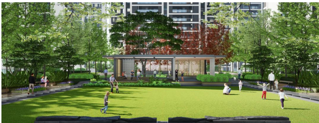
图：上海金地嘉源大树聚场效果图（上图）与实景（下图）

上海金地嘉源（2022年全国十大品质作品）的超大中央景观以“大树聚场”为中心，开阔的阳光大草坪中间设有树下会客厅，两侧则环绕着银杏林荫道。相较于效果图，草坪上增添了精心布置的雕塑与标识，让整体景观更具吸引力，从而营造一个既美观又实用的社区公共空间。