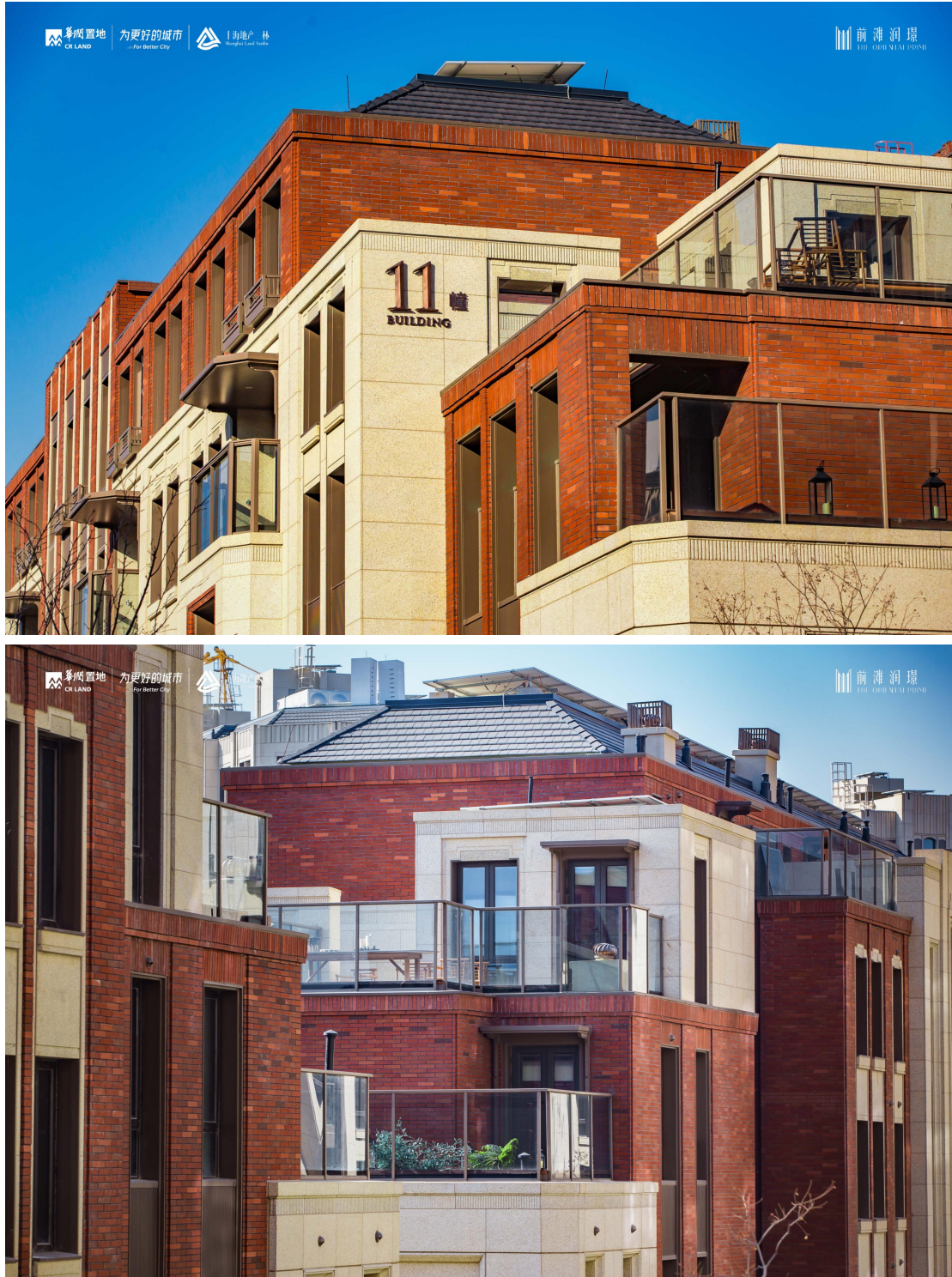
图：上海前滩润璟建筑立面实景

而在招商西安序（2022年全国十大高端作品）的精工打造中，“慢工出细活”的匠心精神贯穿始终。为了更好的呈现出“自然森林”的意境，工作人员跨越四省，历经百余次严格甄选，才锁定19棵形态各异的乌桕树，并完整移植至园林之中；在大面积落地窗的安装