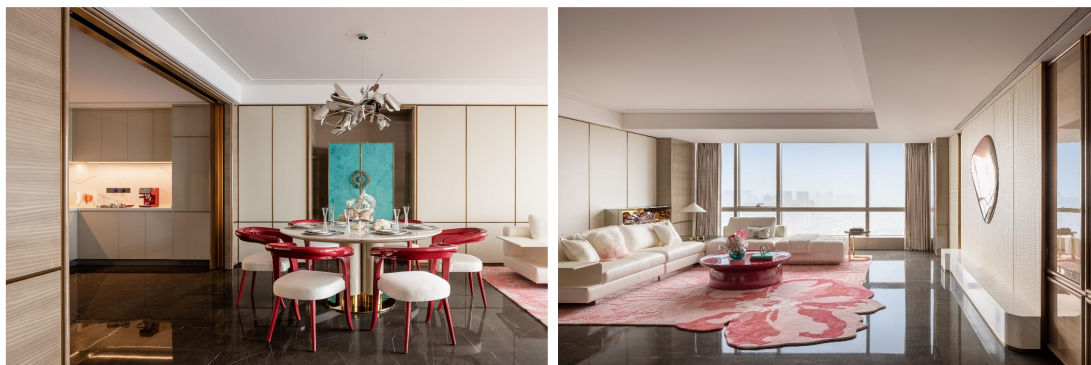
图：成都嘉佰道室内公区样板间（上图）与实际交付实景（下图）

强交付力更能让产品的美学价值得以完整呈现。成都嘉佰道（2023年全国十大高端作品）以艺术化为核心竞争力，这一理念贯穿项目始终。在预售阶段，嘉佰道的样板间设计凭借艺术感和创新性，成功吸引了市场关注并留下了深刻印象。而交付时，业主所见的房屋状态与样板间高度一致，只是移除了软装部分。室内墙面采用烤漆工艺，厨房一体柜、主卧衣柜以及客厅储藏柜均为实体交付，既保留了实用性，又完美复刻了样板间所营造的艺术氛围，堪称一次极具诚意的交付。