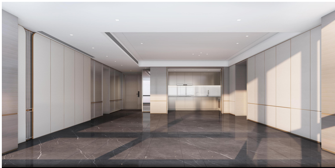
图：成都嘉佰道卧室样板间（左图）与实际交付实景（右图）