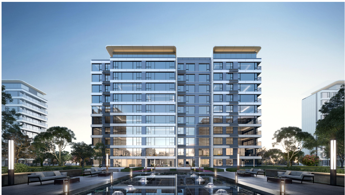
图：济南保利臻誉建筑立面效果图（上图）与实景（下图）

济南保利臻誉（2023上半年全国十大高端作品）的 建筑立面完美还原了设计初衷 。项目采用全铝外墙材质，以L型圆角折板勾勒出建筑的轮廓，展现出流畅且富有力量感的线条。横向浅色铝板、阳台大面积落地玻璃、主卧转角落地窗相互搭配，更添上了几分精致与优雅。实景中，金属的光泽与璃的琉光相互交织，反射出丰富的光影变化，使得建筑立面的 质感比效果图更加细腻且强烈 。