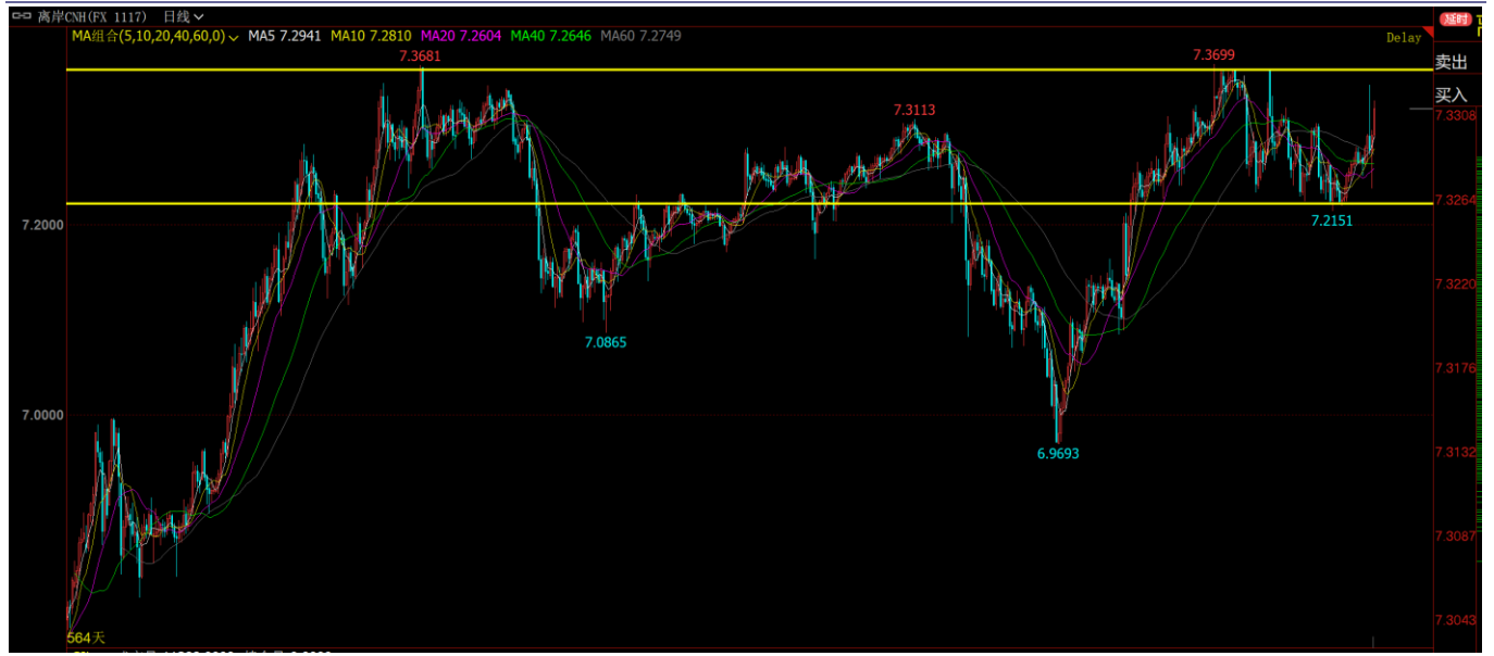
图表5: 人民币后续预计区间震荡运行