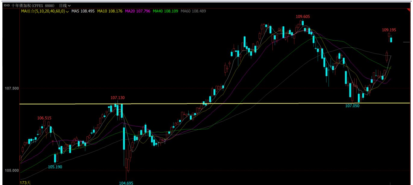
图表2: 10年期国债期货半年线企稳后, 突破60日均线压力