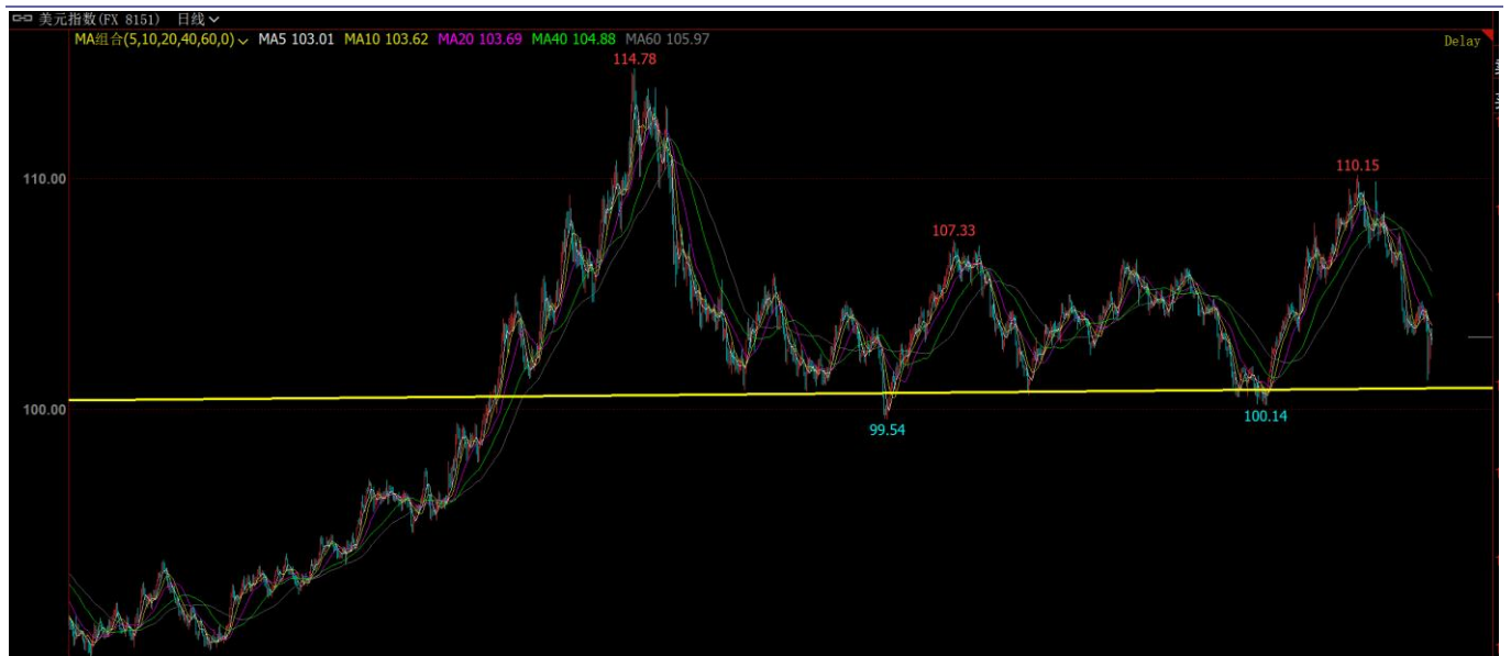
图表6: 美元指数下方支撑较强, 预计后续大幅下跌可能性不大