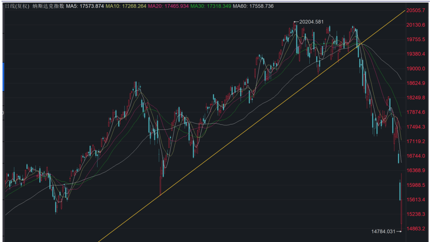
图表4: 纳斯达克处于空头趋势中