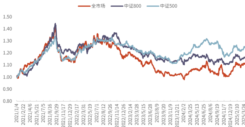
图 6: PB-ROE-50 组合样本外超额净值曲线

注: 回溯区间为 2021.01.04-2025.04.11