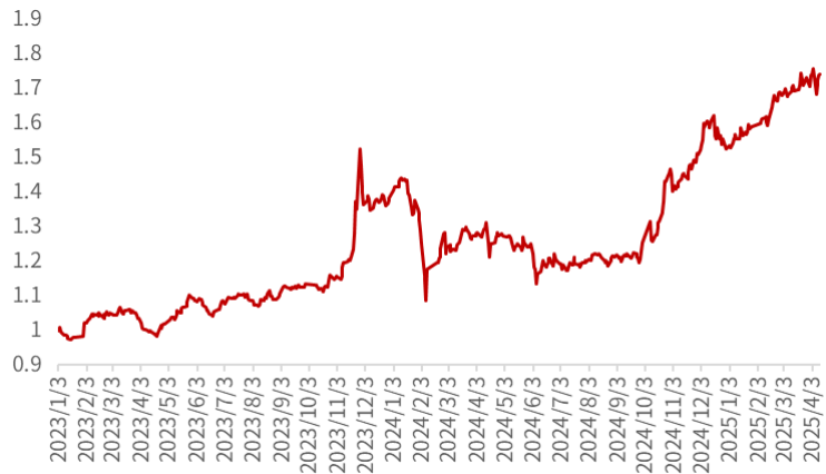
图 8：大宗交易组合超额净值曲线

资料来源：Wind，光大证券研究所；注：回溯区间为 2023.01.03-2025.04.11