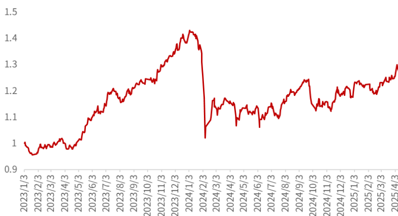
图 9：定向增发组合超额净值曲线

资料来源：Wind，光大证券研究所；注：回溯区间为 2023.01.03-2025.04.11