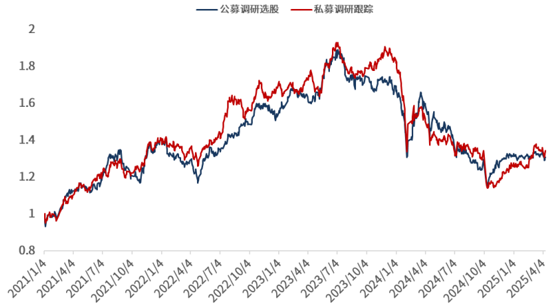
图 7：机构调研组合超额净值曲线

资料来源：Wind，光大证券研究所；注：回溯区间为 2021.01.04-2025.04.11