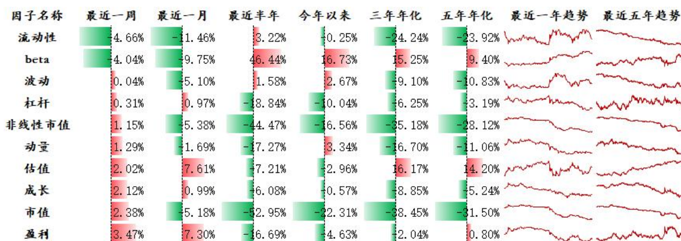
图表2：风格因子多空收益表现