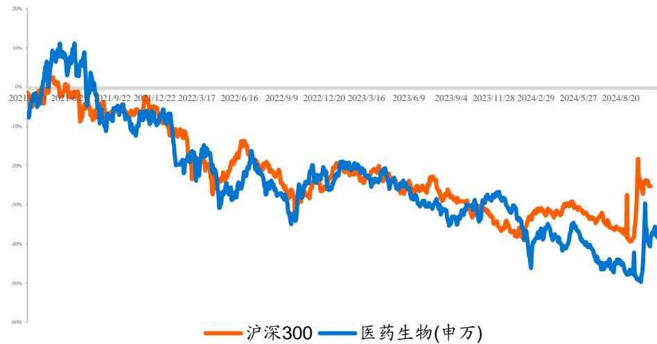
图1：医药行业 2021 年初至今（2025 年 1 月 17 日）市场表现

本周、年初至今 A 股医药指数涨幅分别为 2.67%、-3.84%，相对沪深 300 的超额收益分别为 0.53%、-0.73%；本周、年初至今 H 股生物科技指数涨跌幅分别为 2.19%、-3.28%，相对于恒生科技指数跑赢-2.94%、-3.53%；A 股医药本周医疗器械本周生物制品（+3.19%）、医疗器械（+3.08%）及化学制药（+2.84%）等股价涨幅较大，医疗服务（+2.18%）、中药（+2.08%）及医药商业（+1.72%）等股价涨幅较小；本周 A 股涨幅居前大博医疗（+21.74%）、锦好医疗（+21.34%）、常山药业（+18.88%），跌幅居前 *ST 普利（-15.63%）、康为世纪（-14.19%）、九典制药（-11.23%）；本周港股涨幅居前和铂医药（+19.50%）、百济神州（+13.40%）、腾盛博药（+11.93%），跌幅居前来凯药业（-20.40%）、云顶新耀（-15.01%）、科迪-B（-13.38%）。涨跌表现特点：本周大小市值个股均出现普涨，但小市值个股涨幅更加明显。